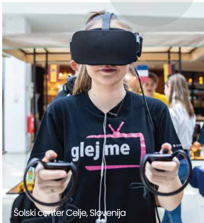
Šolski center Celje, Slovenija

Verkmenntaskolinn á Akureyri Akureyri comprehensive college